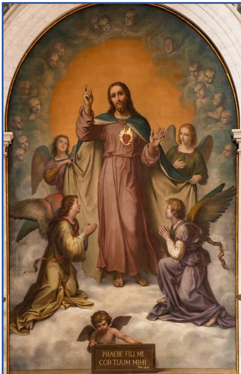
Sagrado Corazón del altar mayor de la Basílica menor del Sacro Cuore. Roma. Construida por Don Bosco