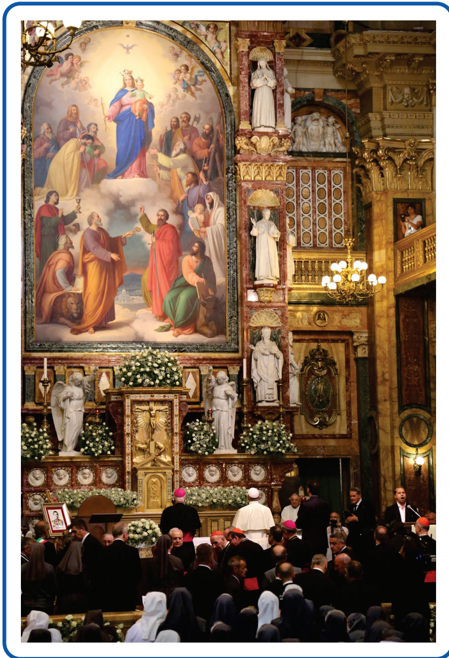
Visita del Papa Francisco al Santuario de María Auxiliadora Turín - Italia. 21-22 Junio de 2015.